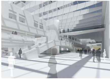
Entree Onderwijscentrum vanuit de backbone (architect Onderwijscentrum: Claus + Kaan)