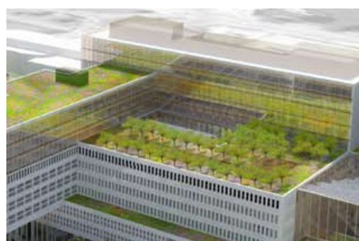
Daktuinen en sedumdaken