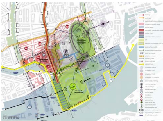
Plankaart Gebiedsvisie Rotterdam Hoboken 2030

Het Erasmus MC ligt in het deelgebied Hoboken. In de nieuwbouw is ook Erasmus MC-Daniel den Hoed, nu nog gevestigd in Rotterdam Zuid, ondergebracht. Voor dit gebied Hoboken heeft de gemeente een gebiedsvisie ontwikkeld: in 2030 is het een gebied met internationale allure met voor het Erasmus MC een centrale positie. In de plannen is ruimte ingebouwd voor recreatie (Het Park), cultuur (Museumpark met o.a. Museum Boymans van Beuningen, de Kunsthal en het NAI), onderwijs (Hogeschool Rotterdam, Erasmiaans gymnasium en Erasmus MC), wonen en de zorgsector , medische en wetenschappelijke ambities van het Erasmus MC. Speerpunt van de visie is het versterken van de Rotterdamse medisch gerelateerde economie. Deze sector is momenteel goed voor 17% van de werkgelegenheid in de stad. Hiermee is de zorg economie een belangrijke pijler onder de Rotterdamse economie. Het Erasmus MC investeert de komende tien jaar € 1 miljard in het gebied.