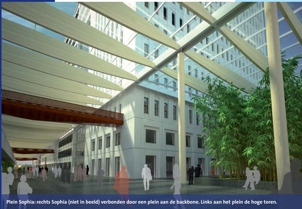
Plein Sophia: rechts Sophia (niet in beeld) verbonden door een plein aan de backbone. Links aan het plein de hoge toren.