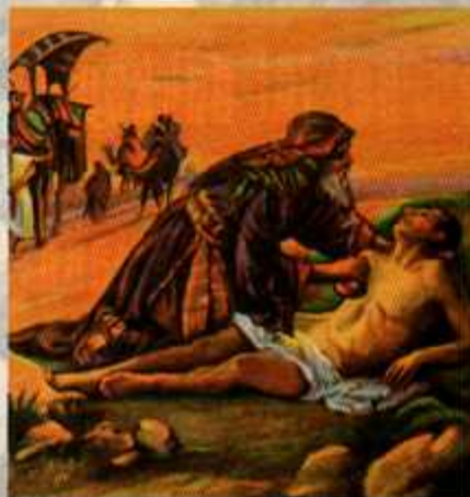
Fig. 1: De barmhartige Samaritaan, naar het verhaal uit de Bijbel.

Zij worden ook wel Samaritaanse donoren genoemd, omdat ze net als de Bijbelse barmhartige Samaritaan geen tegenprestatie verlangen voor hun levensreddende aanbod (figuur 1).