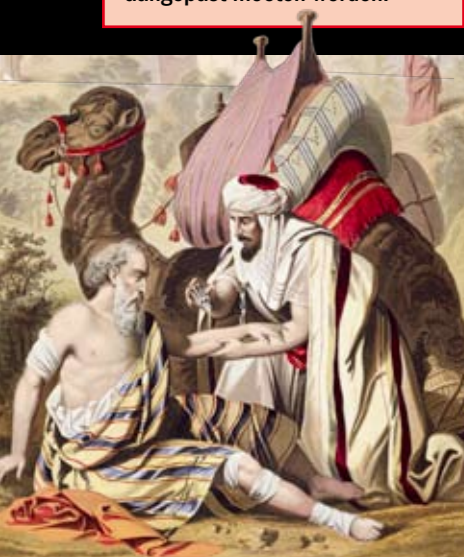
Samaritaanse donatie is vernoemd naar de barmhartige samaritaan uit de bijbel. Waar een priester en een tempeldienaar een halfdode man langs de weg lieten liggen, hielp de Samaritaan de man wel.