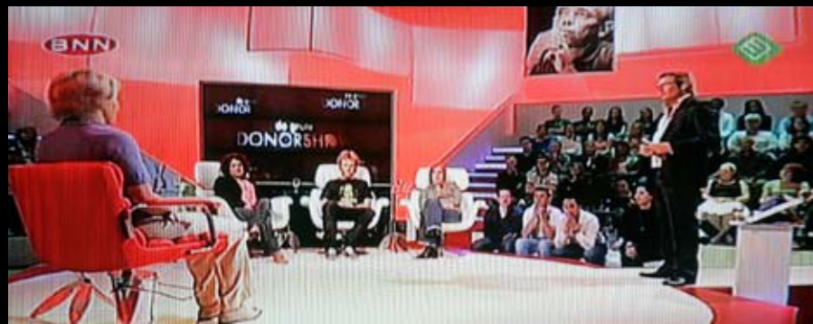
BNN fopte in 2007 de hele wereld door te doen alsof er in een tv-show een nier werd weggegeven. Het bleek een stunt te zijn om het tekort aan donoren aan de kaak te stellen.