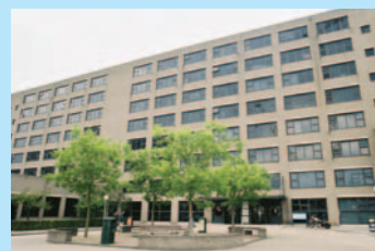
L-gebouw Erasmus Universiteit Rotterdam