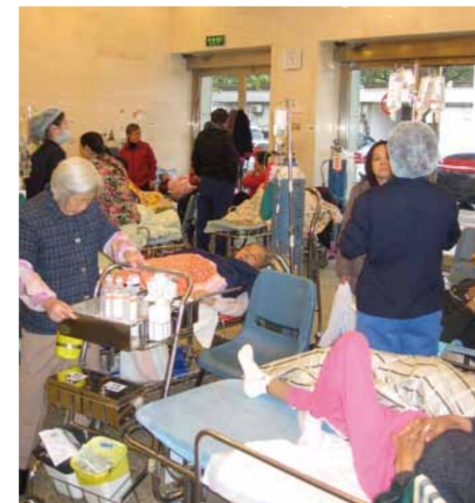
Hal van de SEH, direct voor de voordeur waar de patienten binnenkomen. Patienten liggen hier soms dagen voordat ze naar een afdeling kunnen gaan. Totaal geen privacy, het was 2 graden buiten, deur staat vaak open, veel familie bij de patient.

Het bestrijden van pijn is in de Nederlandse gezondheidszorg erg belangrijk. Op de SEH is dit naast de