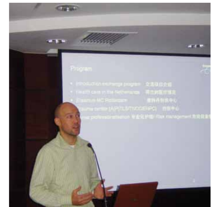
Presentatie die ik gegeven heb aan de artsen en verpleegkundige van het Ruijin hospital. Presentatie ging over de Nederlandse gezondheidszorg, de manier hoe wij met behulp van de ATLS op de SEH werken, verschillen die ik heb gezien tussen Nederland en China, bijvoorbeeld verschil in pijn management

Ter afsluiting van mijn werkbezoek heb ik een presentatie gegeven voor de artsen en verpleegkundigen van de Emergency Department. Hierin heb ik onder andere teruggekeken op mijn stage in het Ruijin Hospital en mijn ervaringen gedeeld met mijn Chinese collega's. In de presentatie heb ik de basisbeginselen van de ATLS/TNCC uiteen gezet en het advies gegeven betreffende de mogelijkheden van scholing in de ATLS/TNCC. Mogelijk kan één van mijn TNCC instructeurs geschoolde collega's naar Shanghai om daar les te geven. Onderzoek naar het verschil van pijnmanagement, de behandeling van brandwonden slachtoffers, uitwisselen van protocollen, kennis en kunde zijn onderwerpen van een mogelijk samenwerkingsverband op verpleegkundig niveau.