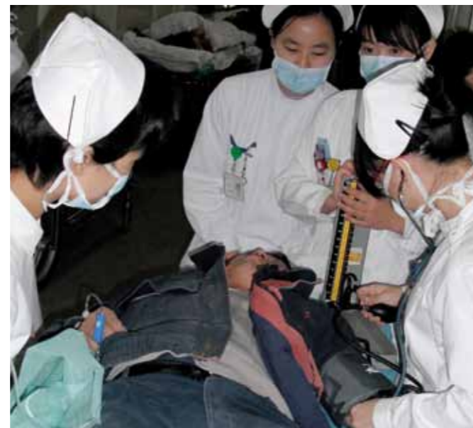
Patiënt met ruggenwervel letsel wordt opgevangen op een seh, zonder daarbij enige vorm van protectie