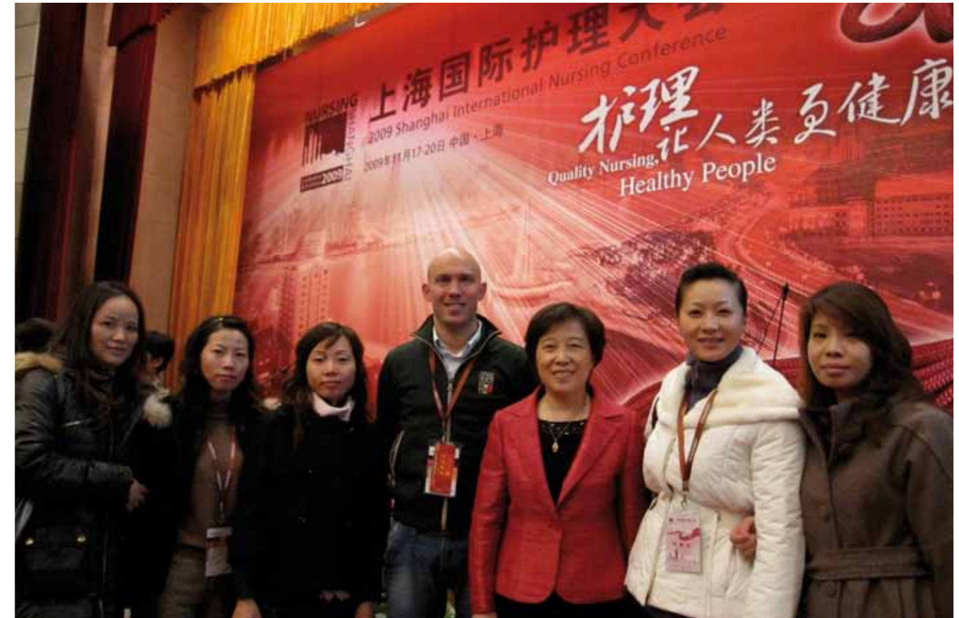
Samen met Chinese collega's naar een congres.

de patiënt opgetild en ongeveer 20 meter verplaatst. Hij voelt zijn benen niet en kan deze ook niet bewegen, naast de pijn in zijn buik verder geen andere klachten. De voeten liggen gedraaid naar buiten en vertonen geen enkele reactie en geen spiertonus. De buik is drukpijnlijk, verdere controles zijn goed. Patiënt krijgt een infuus en wordt vervolgens zonder enige vorm van ruggenwervel bescherming op de brancard getild.