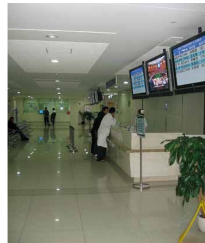
Out patient clinic van het Ruijin hospital, lijkt net een moderne luchthaven wat betreft uitstraling, efficiëntie en opzet

In de Chinese gezondheidszorg is er geen echte huisarts. Om dit op te vangen is er een zeer grote Outpatient Clinic, polikliniek, waar patiënten met hun gezondheidsklachten naar toe kunnen gaan. Dit is groots opgezet in een ultramodern gebouw, dat zowel qua logistiek als qua inrichting op een grote luchthaven lijkt.