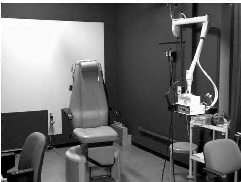
De kamer van het evenwichtsonderzoek